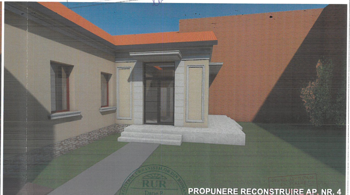
PROPUNERE RECONSTRUIRE AP. NR. 4