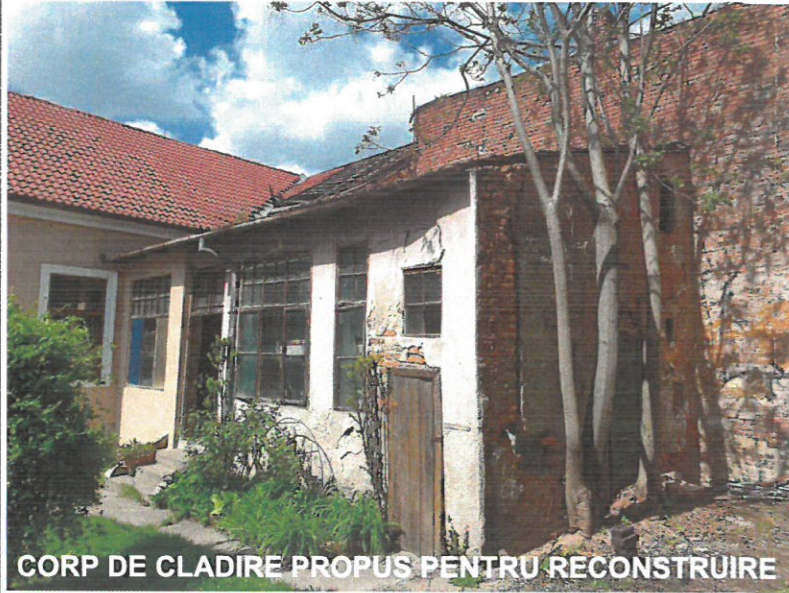
CORP DE CLADIRE PROPUS PENTRU RECONSTRUIRE