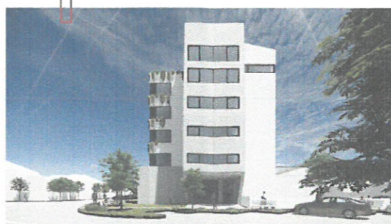
Perspectivă de pe Str. Constantin Mille Cap de perspectivă - element vertical.