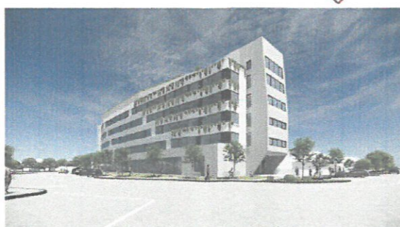
Perspectivă de pe Str. Aurel Vlaicu. Cap de perspectivă, elemente dinamice.