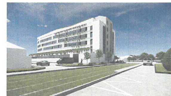
Perspectivă de pe Str. Aviatorilor, dinspre est. Clădirea oferă un volum - ecran spre est, o imagine calmă, accentuată de registre orizontale.