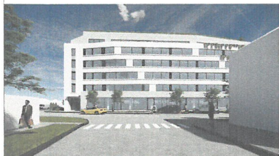
Perspectivă de pe Str. Aviatorilor. Cap de perspectivă, element-ecran, registre orizontale.