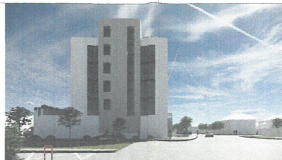
Perspectivă de pe Str. Sirenei Cap de perspectivă - element vertical.