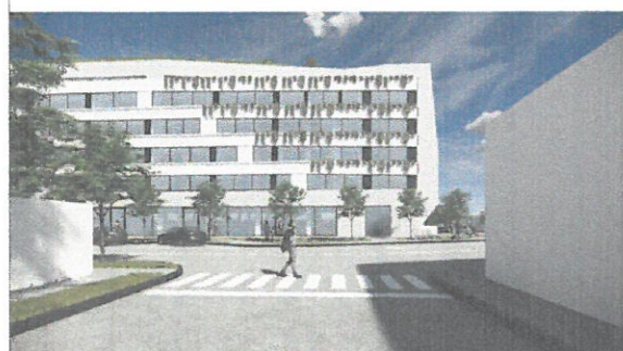
Perspectivă de pe Str. Aviatorilor. accentuarea orizontalei