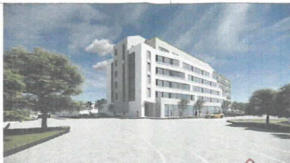
Perspectivă de pe Str. Lipovei. Cap de perspectivă, accentuarea perspectivei prin retrageri succesive.