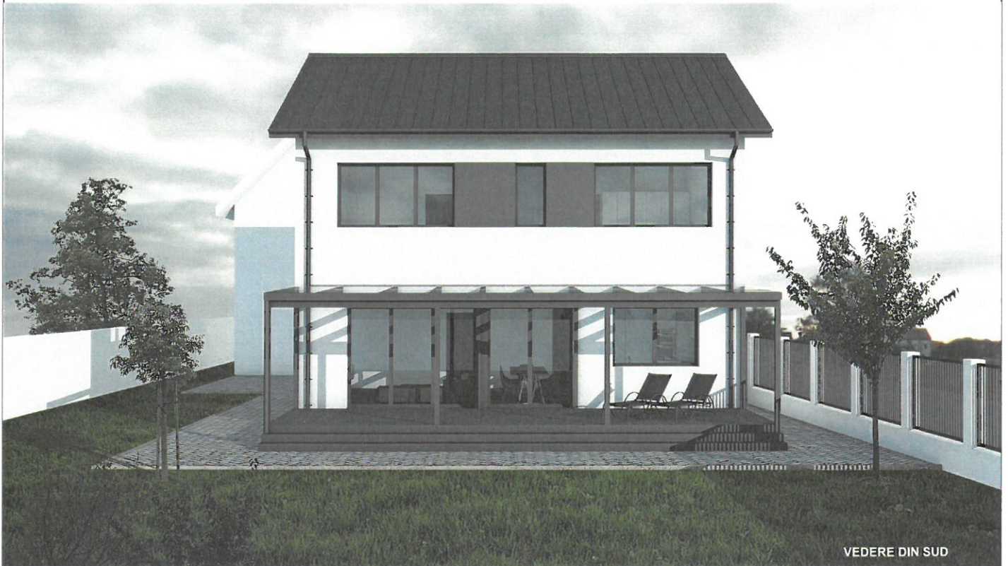
VEDERE DIN SUD

jud. Bihor, mun. Oradea, str. Facilei, nr. 43A, nr.cad. 205465