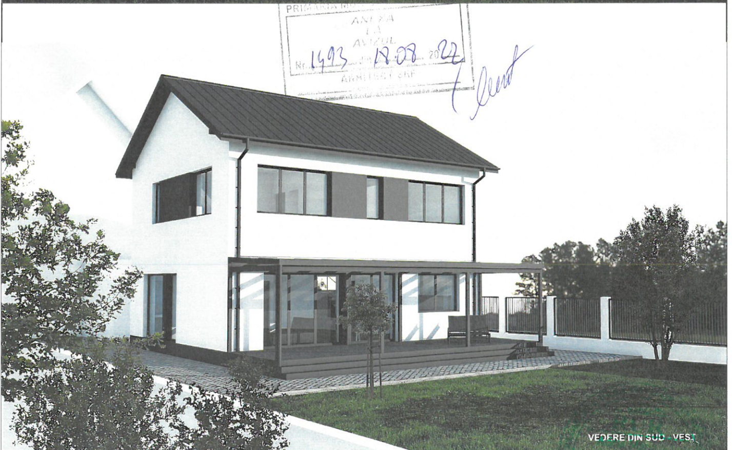
VEDERE DIN SUD - VES.